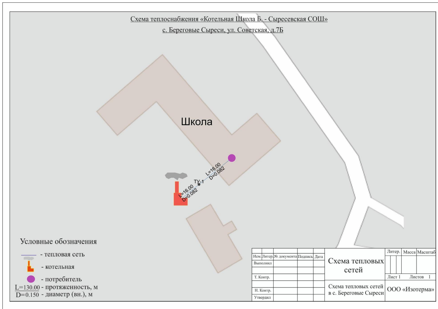
Рисунок 10. Зона действия котельной Б.-Сыресевская СОШ